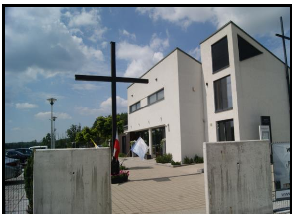
Kaplica pw. Św. Matki Teresy z Kalkuty