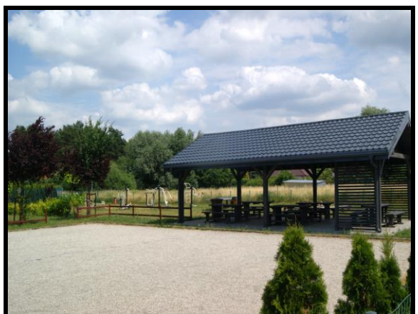
Miejsce spotkań i rekreacji mieszkańców