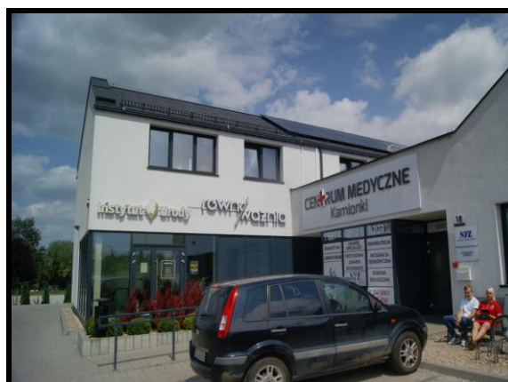
Centrum Medyczne w Kamionkach