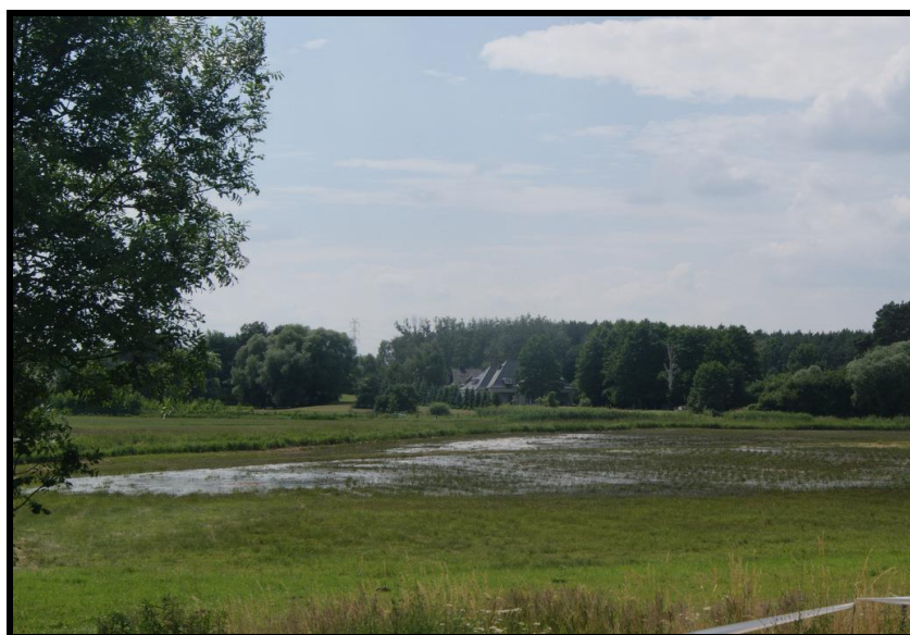
Dolina rzeki Głuszynki