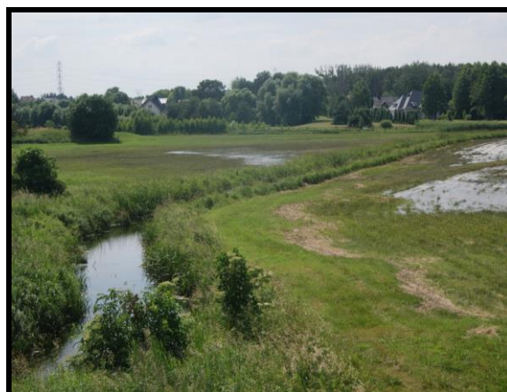
Dolina rzeki Głuszynki