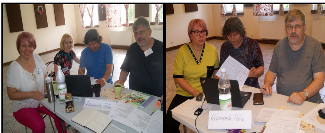
Grupa Odnowy Wsi w czasie warsztatów opracowania Sołeckiej Strategii Rozwoju. Świetlica OSP w Kamionkach w dniach 17-18.VII.2021r.